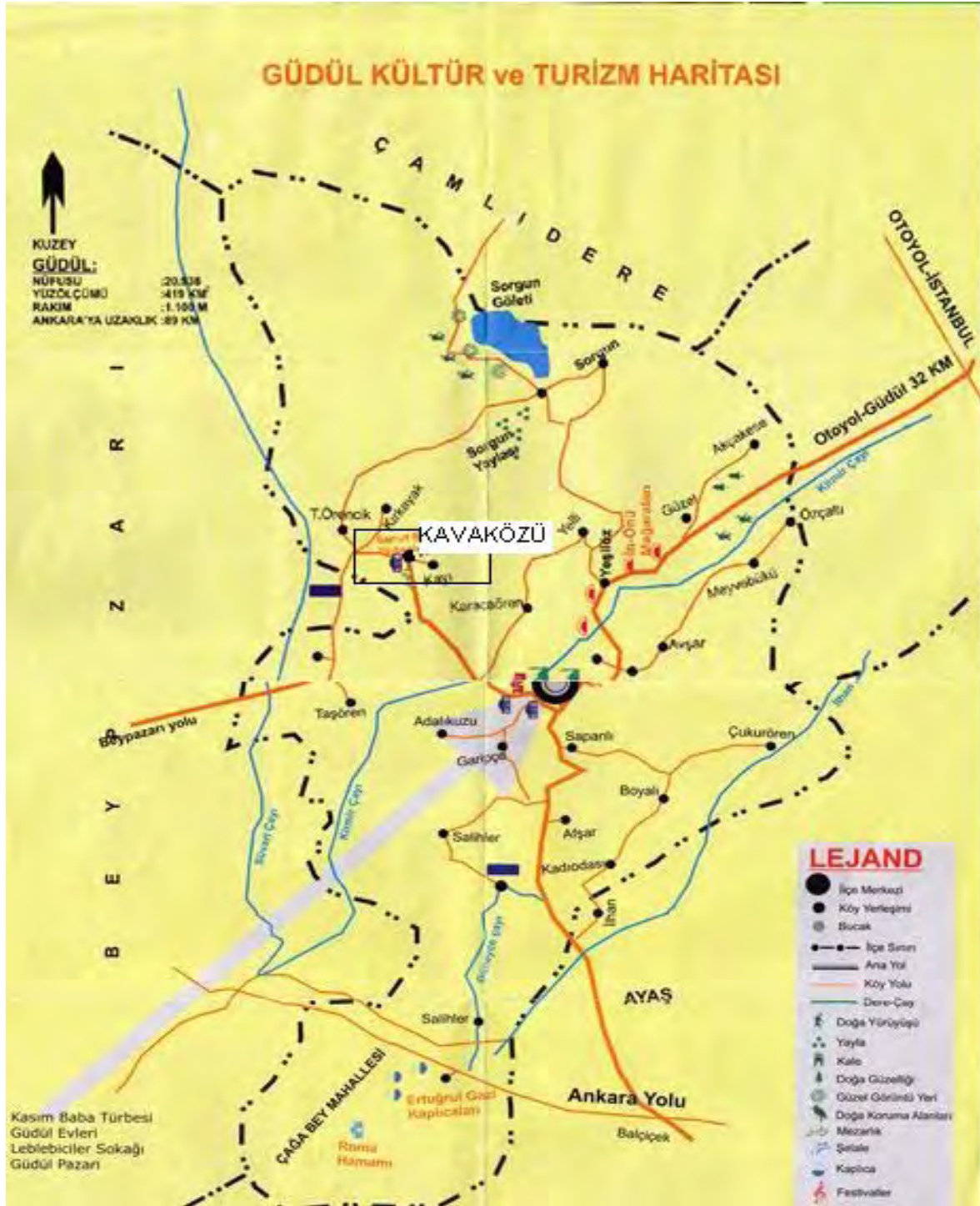
Harita 1: Gündül ve Kavaközü Köyü

ise, meyve bahçeleri, üzüm bağları, karasal iklime uyum göstermiş ağaç toplulukları ve ekim alanları yer alır.