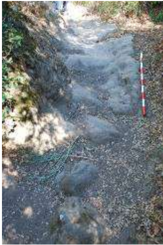
Res.5- Rahmanlar 2 köprüsüne bağlanan Hypaipa istikametindeki geçit

Bu üç köprü, Hypaipa civarındaki Roma ve Geç Antik dönemlerdeki yoğun trafiğin en belirgin tanıklarındır ve ister batıdan gelip Hypaipa üzerinden kuzeye, Sardeis'e uzansın, isterse de doğudan gelip batıya gitsin, Kaystros Ovası'nın kuzeyine yönelen tüm yolların Hypaipa civarından geçtiğine tanıklık etmektedir. Yoğun bir trafiğe sahne olduğu anlaşılan kent, kuzeyden Sardeis, doğudan Neikaia, Dioshieron ve batıdan Ephesos üzerinden gelen yolların kavşak noktasında, tüm Doğu Küçük Menderes vadisine hakim stratejik bir noktada kurulmuştur. Batıdan Ephesos-Belevi ve Teira (Tire) üzerinden gelen yol Hypaipa'ya varmak için, güneye doğru önce Kaystros ırmağını, sonra da onun kollarından Rahmanlar Çayı'nı doğu-batı istikametinde aşmak zorundadır.