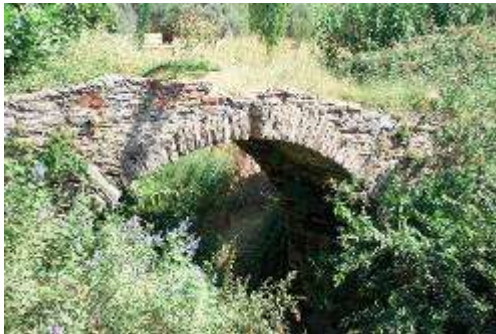
Res.2- Rahmanlar Köprü 1

Ortaköy Köprüsü'nün 2 km, Üzümlü Köyü'nün ise 300 m kadar kuzeyindeki ikinci köprüye (Rahmanlar 2- 37°.47.827" K-028°.05.46" D), eski bir zeytinyağı işletmesinin yanındaki patikadan doğuya doğru yürünerek ulaşılır. Günümüze en iyi durumda kalan köprü tüm elemanlarıyla ayaktadır. İlkine benzer bir teknikte dönüşümlü olarak yerleştirilmiş tuğla ve taş örgülüdür. Horasan harç kullanılan örgüde zaman zaman antik mermer bloklardan yararlanılmıştır. Genişliği 7.40 m., yüksekliği 5 m., ayak genişliği 2.45 m., kemer genişliği 0.70 m. kadardır. Korkuluk ve yüzey kaplamaları günümüze kadar gelmiştir. Bugün kullanılmayan ve fakat iyi durumdaki köprü, Üzümlü ve Günlüce köylerini birbirine bağlayan doğal bir geçide yol vermektedir. Hypaipa antik kentinin 1.7 km kadar batısındaki köprü en kısa güzergah üzerinde ve kritik bir geçide giden konumdadır (Res.4). Ortadaki Üzümlü (Rahmanlar 2) Köprüsü'nün 700 m kadar kuzeyinde üçüncü bir köprü yer alır. Dereuzunyer köyünün 300-400 m güneydoğusundaki köprü (Rahmanlar 3- 38°16'47.88"K-27°55'59.97"D), diğerlerinden farklı olarak tamamen kireç-harç ve moloz taş örgülüdür. İnşa tekniği, günümüzde hala kullanılan bu köprünün diğer ikisine kıyasla biraz daha geç bir döneme ait olduğunu düşündürmektedir. Genişliği 7 m., yüksekliği 4.50 m., ayak genişliği 3 m. kadardır. Aynı akarsu üzerinde kurulmuş olmaları nedeniyle, su seviyesinin yüksekliği değişmediği için kemer açıklığı, genişlik ve uzunlukları birbirine yakın özellikler gösterir.