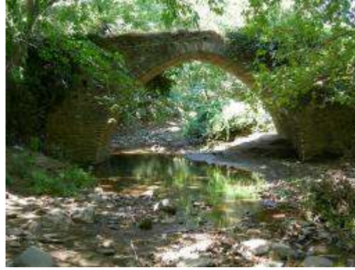
Res.4- Rahmanlar Köprü 3

Bu üç köprü, Hypaipa civarındaki Roma ve Geç Antik dönemlerdeki yoğun trafiğin en belirgin tanıklarındır ve ister batıdan gelip Hypaipa üzerinden kuzeye, Sardeis'e uzansın, isterse de doğudan gelip batıya gitsin, Kaystros Ovası'nın kuzeyine yönelen tüm yolların Hypaipa civarından geçtiğine tanıklık etmektedir. Yoğun bir trafiğe sahne olduğu anlaşılan kent, kuzeyden Sardeis, doğudan Neikaia, Dioshieron ve batıdan Ephesos üzerinden gelen yolların kavşak noktasında, tüm Doğu Küçük Menderes vadisine hakim stratejik bir noktada kurulmuştur. Batıdan Ephesos-Belevi ve Teira (Tire) üzerinden gelen yol Hypaipa'ya varmak için, güneye doğru önce Kaystros ırmağını, sonra da onun kollarından Rahmanlar Çayı'nı doğu-batı istikametinde aşmak zorundadır.