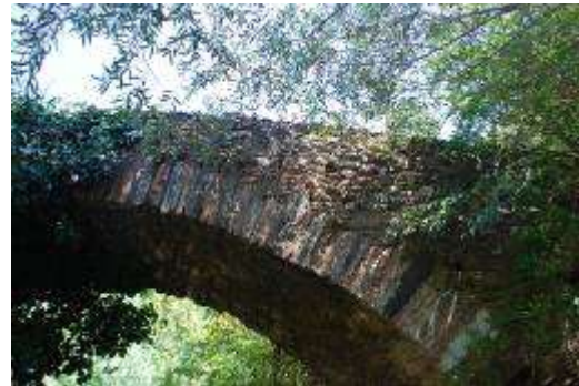
Res.3- Rahmanlar Köprü 2