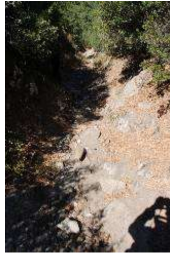
Res.6- Subatan Yaylasından inen antik yol

Küçük Menderes nehrinin nasıl aşıldığı konusunda hiçbir bilgiye sahip değiliz. Bu nehrin üzerinde çok gözlü büyük bir köprünün var olduğuna işaret eden antik izler bulunmamaktadır. Ancak, Eskiçağlarda büyük bataklık ve sazlıklarla kaplı olduğu anlaşılan Kaystros Ovası'nda karayolu sistemlerinin, biri güneyden Messogis Dağları, öteki kuzeyden Tmolos Dağları eteklerindeki daha