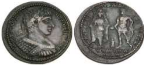
Resim 4- Ön yüzde İmparator (Elagabalus M.S.218-222), arka yüzde İmparator elindeki patera (phiale) ile tanrıça Anahitaya sunu yapmaktadır

Bölgedeki Pers etkisinin Roma döneminde devam etmesine örnek olarak; Lydia'da Ödemiş yakınında yer alan antik dönem Hypaipa'sından başka, Akhisar'a bağlı Beyoba ile Sazoba köylerine yakın bir mevkide konuşlanan ve daha önceki adı Hierakome ( Kutsal Köy ) olan antik Hierokaisareia'da bulunan ve Artemis Anaitis kültüne ait epigrafik bir kanıtı da gösterebiliriz. Sazoba Köyü yakınında bulunan bu yazıt İmparator Tiberius Claudius'un saltanat dönemine (M.S. 41-51) tarihlenmiştir. Yazıtta üç Romalı göçmen kadının, tanrıçanın tapınağına bu yazıtı adak olarak sundukları belirtilmekte ve böylece Lydia'daki Romalı göçmenlerin bu Pers kültürünü benimsedikleri anlaşılmaktadır. Sayıları ne olursa olsun, belli bir grup Perslinin Post-Akhaimenid evrede Lydia Kaystros vadisinde Roma İmparatorluk Dönemi içlerine kadar yaşamış oldukları düşünülmektedir. Bölgedeki Anahita kültürünün varlığının Roma İmparatorluk Döneminde daha da güçlenmiş bir kültik görünümle karşımıza çıkışı yörede basılmış imparator sikkelerine de yansımıştır. Buna en güzel örneğini Roma İmparatoru Elagabalus (MS. 218-222) döneminden bir sikke (CNG 93) üzerinde görmekteyiz (Resim 4). Ön yüzde imparator büstü, arka yüzde solda Artemis/Anahitis kült heykeli, sağda ise İmparator Elagabalus, askeri giysileriyle, bir altar önünde elinde sunu kabı olan patera (phiale) ile asasıyla ayakta durur vaziyette verilmiştir.