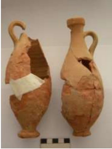
Resim 3- Yeniceköy/Ödemiş Lahdi kontekstinde ele geçen lekythoslar

kırık ve eksik olup, yüksekliği 16.3 cm.; kaide çapı 3,2 cm.; gövde çapı 7,8 cm.; boyun çapı 3.1 cm. dir. İkinci lekythosun ağız çapı 3 cm.; yüksekliği 19.5 cm.; kaide çapı 3 cm.; gövde çapı 7,8 cm.; çeper kalınlığı 4 mm.dir. Kil rengi 7,5 YR: 7/8 ve astar rengi: 7,5 YR: 8/4 dir (Resim 3).