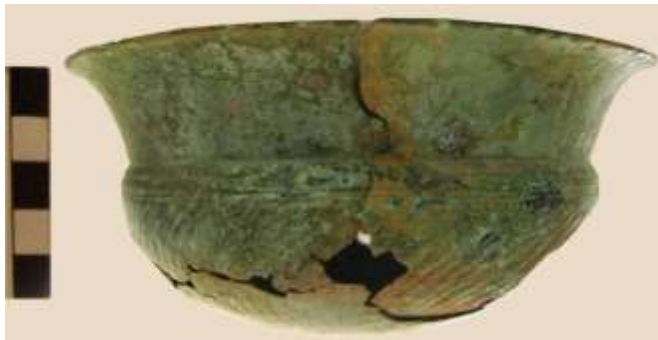
Resim 2- Akhaimenid Bronz Kâse, Tire tipi kabaralı Yeniceköy/Ödemiş buluntusu pişmiş toprak lahit kontekstinde ele geçmiştir.

Omphaloslu bronz kâse okside olmuştur ve kırık parçalar halindedir. Hassasiyeti nedeniyle çizimi mümkün olmamıştır (Resim 2). Dışa çekik ağız kenarlı, yüksek boyunlu, keskin omurgalı kabın gövdesi hafif diagonal kabartılarla bezelidir. Çapı 12.8 cm., yüksekliği 6.1 cm., kalınlığı 1.5 mm., omphalos derinliği 0.5 cm., çapı 2.4 cm. dir.