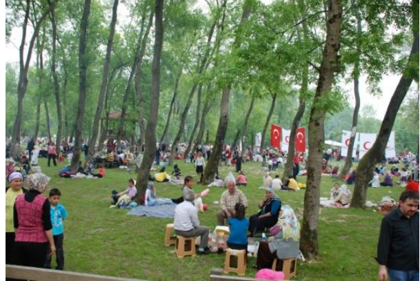
Fotoğraf 16: Kent Ormanında gerçekleştirilen Hıdrellez etkinliklerinden bir görünüm.

Çaycuma ilçe merkezindeki kutlamaları kırsal kesimden ve diğer ilçe merkezlerinden ayıran bir diğer önemli özellik, kutlamaların şenlik havasında geçmesidir. Bu nedenle özellikle kutlamaların hafta sonuna denk geldiği günlerde; başta İstanbul, Bursa, Kocaeli, Bartın, Karabük, Bolu, Düzce, Kastamonu olmak üzere yakın illerde yaşayan Zonguldaklıların da katıldığı gözlenmektedir. Hıdrellez'in kutlandığı mekânlarda çocukların eğlenebileceği lunaparklar kurulur, yetişkinler için çeşitli oyun ve etkinlikler düzenlenir (Fotoğraf 17 ve 18). Alışveriş için çeşitli stantlar açılır. Bu bakımdan Hıdrellez mekânı bir panayır alanını andırır (Fotoğraf 19 ve 20).