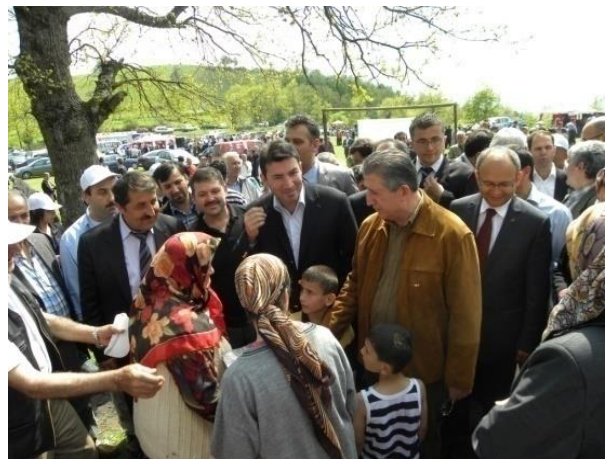
Fotoğraf 6: Dağüstü köyündeki etkinliklere yöre halkının yanı sıra gurbetteki Zonguldaklılar da katılmaktadır.

Köylerde Hidrellez sabahı erken kalkılıp günün ilk ışıklarıyla beraber dilekler tutulur ve dualar edilir. Hıdırlığa götürülecek yiyecek ve içeceklerin hazırlığı yapılır. Sabahın ilerleyen saatlerinde etkinliğin