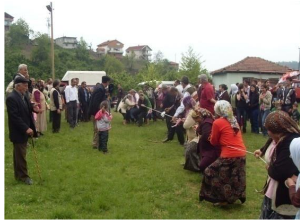
Fotoğraf 4: Gümeli Beldesi'ndeki Hidrellez etkinliklerinde düzenlenen ip çekme oyunundan bir görünüm.

Günümüzde Hidrellez etkinliği kapsamında birçok köyde genellikle cami altında bulunan köy odasında toplanılır ve birlikte yemek yenilip mevlit okutulur. Bununla birlikte Çaycuma ilçesine bağlı Dağüstü, Kadioğlu, Kızılbel, Kalafatlı, Taşçılı, Güzelyaka, Güdüllü, Akçahatıpler, Şeyhler, Güzeloğlu, Çomranlı, Kışla, Karamusa, Erenköy, Dereköseler, Kayıkçılar, Şenköy ve Emirşah köylerinde yeşilin ve ağacın bol olduğu mekânlarda Hidrellez kültürel ve dini bir faaliyet olarak kutlanır.