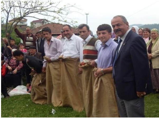
Fotoğraf 3: Alaplı ilçesine bağlı Gümeli Beldesi'ndeki Hidrellez etkinliklerinde sergilenen çuval yarışından bir görünüm.