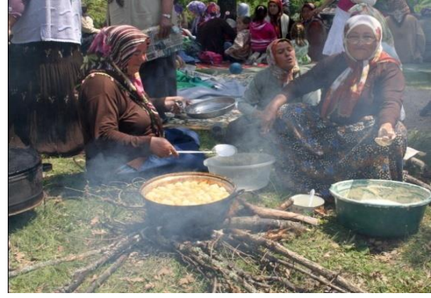
Fotoğraf 8: Hıdrellez günü hıdırlığa gelenlere ikram etmek için lokmalar çekilir.

Her ne kadar Hıdrellez 6 Mayıs gününe karşılık gelse de günümüzün ekonomik hayatının bir gereği olarak bazı köylerde hafta sonu tatiline denk getirmek amacıyla, o haftanın pazar günü tercih edilir. Bu sayede çalışanların ve gurbette olanların da katılımı sağlanabilmektedir. Bu yönüyle Hıdrellez etkinlikleri birer rekreasyonel faaliyet olarak da nitelendirilebilir.