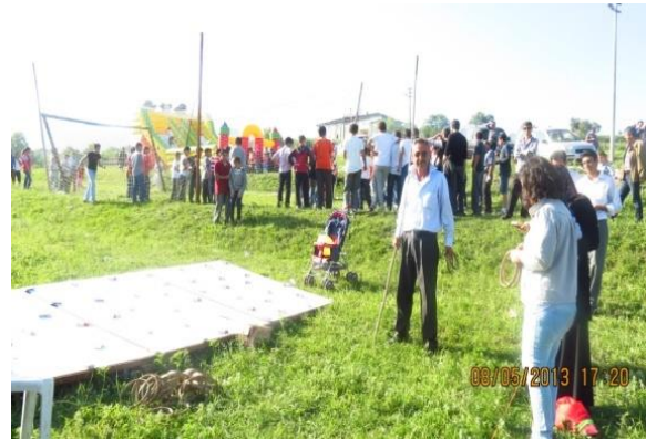
Fotoğraf 18: Hıdrellez'in kutlandığı mekânlarda yetişkinler için çeşitli oyun ve etkinlikler düzenlenir.