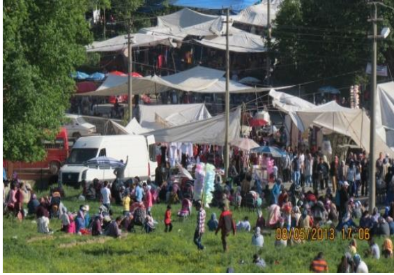
Fotoğraf 19: Hidrellez'in kutlandığı mekânlarda alışveriş için çeşitli stantlar açılır.