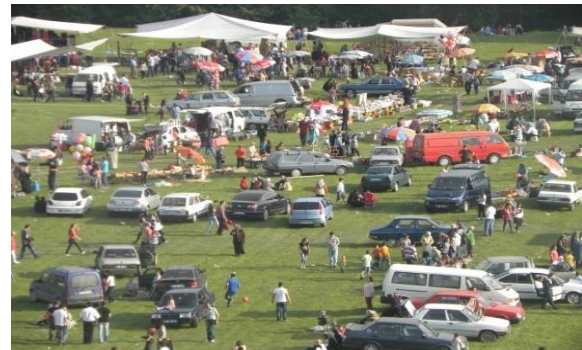
Fotoğraf 14: Nadır Mevkii'nde gerçekleştirilen Hidrellez etkinliklerinden bir görünüm.