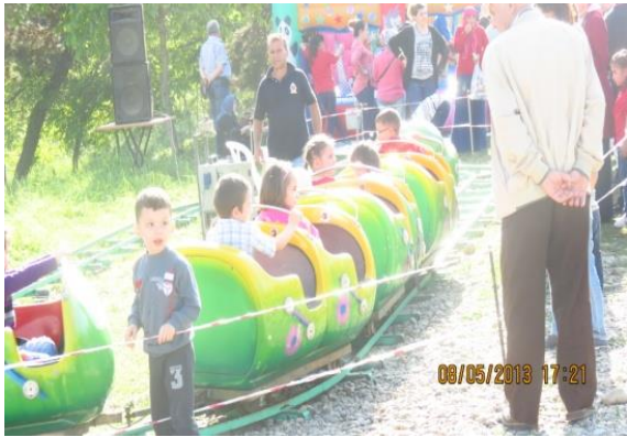
Fotoğraf 17: Hıdrellez'in kutlandığı mekânlarda çocukların eğlenebileceği lunaparklar kurulur.

Çaycuma ilçe merkezindeki kutlamaları kırsal kesimden ve diğer ilçe merkezlerinden ayıran bir diğer önemli özellik, kutlamaların şenlik havasında geçmesidir. Bu nedenle özellikle kutlamaların hafta sonuna denk geldiği günlerde; başta İstanbul, Bursa, Kocaeli, Bartın, Karabük, Bolu, Düzce, Kastamonu olmak üzere yakın illerde yaşayan Zonguldaklıların da katıldığı gözlenmektedir. Hıdrellez'in kutlandığı mekânlarda çocukların eğlenebileceği lunaparklar kurulur, yetişkinler için çeşitli oyun ve etkinlikler düzenlenir (Fotoğraf 17 ve 18). Alışveriş için çeşitli stantlar açılır. Bu bakımdan Hıdrellez mekânı bir panayır alanını andırır (Fotoğraf 19 ve 20).