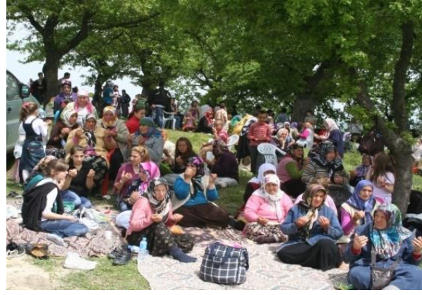
Fotoğraf 2: Dağüstü köyü Hidrellez etkinlikleri esnasında, mevlit sonrası dua eden katılımcılardan bir görünüm.

Köy okullarının faaliyet gösterdiği yıllarda, kırsal kesimdeki okullarda yaygın olarak kutlanan Hidrellez, taşımali eğitimin başlamasına bağlı olarak köy okullarının kapanması neticesinde öğrenciler arasında eski önemini yitirmiştir. Nitekim geçmişte köy okullarında kır gezisi düzenlenip Hidrellez kutlanırken günümüzde bu tarz bir etkinliğe pek rastlanmaz.