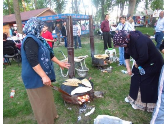
Fotoğraf 22: Börek ve gözlemelerin hamurlarının açılması, hazırlanması ve pişirilmesi etkinlik alanında gerçekleştirilir.