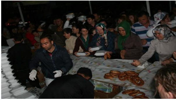
Fotoğraf 9: Devrek Belediyesi Millet Bahçesi'ndeki etkinliklerde Devrek Simidi ikram edilmektedir.