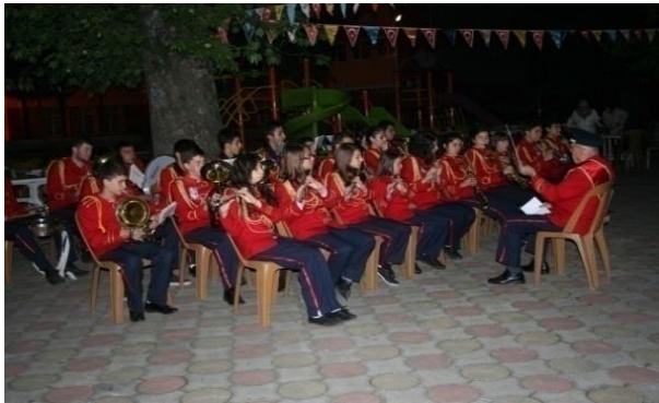
Fotoğraf 11: Devrek Belediyesi'ne ait şehir bandosundan bir görünüm.