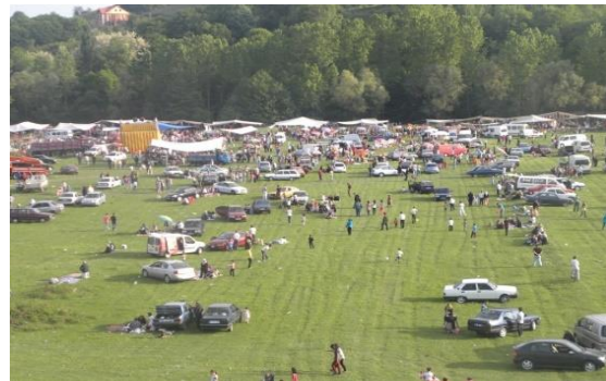
Fotoğraf 13: Hidrellez günü Çaycuma İlçesinin Çay Mahallesi'ndeki NadırMevkiinde Hidrellez etkinlikleri gerçekleştirilir.

Çaycuma ilçesinde Hidrellez etkinlikleri, daha kapsamlı ve coşkulu kutlanması bakımından diğerlerinden ayrılır. Çaycuma Belediyesi'nce organize edilen ve 6-9 Mayıs tarihlerinde ilçe merkezinde birer festival havasında geçen bu etkinlikler; 6 Mayıs'ta Çay Mahallesi'ndeki Nadır Mevkii'nde (Fotoğraf 13 ve 14), 7 Mayıs'ta Çay Mahallesi'ndeki Sıracevizler Mevkii'nde, 8 Mayıs'ta İstasyon Mahallesi'ndeki İstasyon Mesire Alanında, 9 Mayıs'ta Pehlivanlar Mahallesi Kent Ormanı'nda olmak üzere dört farklı mekânda gerçekleştirilmektedir (Fotoğraf 15 ve 16).