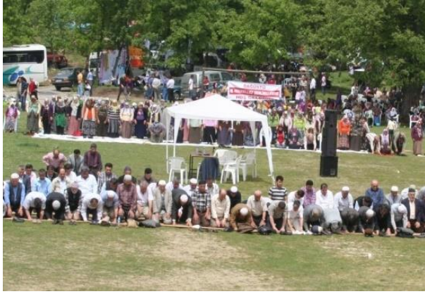
Fotoğraf 1: Çaycuma ilçesine bağlı Dağüstü köyü Hidrellez etkinlikleri esnasında, öğle namazı kılan katılımcılardan bir görünüm.

faaliyete dönüşmüştür (Fotoğraf 1 ve 2). Günümüzde kırsal kesimdeki içkili Hidrellez kutlama geleneği büyük oranda terk edilmiştir.