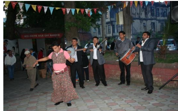
Fotoğraf 12: Millet Bahçesi'ndeki etkinliklerde köçek oyunu da sergilenmektedir.

Çaycuma ilçesinde Hidrellez etkinlikleri, daha kapsamlı ve coşkulu kutlanması bakımından diğerlerinden ayrılır. Çaycuma Belediyesi'nce organize edilen ve 6-9 Mayıs tarihlerinde ilçe merkezinde birer festival havasında geçen bu etkinlikler; 6 Mayıs'ta Çay Mahallesi'ndeki Nadır Mevkii'nde (Fotoğraf 13 ve 14), 7 Mayıs'ta Çay Mahallesi'ndeki Sıracevizler Mevkii'nde, 8 Mayıs'ta İstasyon Mahallesi'ndeki İstasyon Mesire Alanında, 9 Mayıs'ta Pehlivanlar Mahallesi Kent Ormanı'nda olmak üzere dört farklı mekânda gerçekleştirilmektedir (Fotoğraf 15 ve 16).