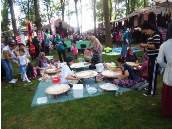
Fotoğraf 21: Hidrellez günü komşu kadınlar bir araya gelerek tüketmek ya da satmak için gözleme, börek gibi yiyecekler hazırlarlar.

Çaycuma şehrinde Hidrellez günü diğer günlerden erken kalkılır. Sabahın erken saatlerinde dilekler tutulup isteklerin gerçekleşmesi için dualar edilir. Sonra ailecek ya da komşularla etkinlik alanına gidilir. Gün boyu piknik, muhabbet, eğlence, oyun ve alışveriş gibi etkinliklerde bulunulur. Çoğu aile, piknik tarzı bir faaliyetle daha önceden hazırladıkları yiyecekleri tüketmektedir. Bazıları ise birkaç ailenin kadınlarının bir araya gelmesiyle gün içerisinde tüketilecekleri köfte, dolma, hamur işi, gözleme, lokma gibi yiyecekleri Hidrellez'in kutlandığı mekânda hazırlamaktadır (Fotoğraf 21 ve 22). Bazı kadınlar pişirdikleri gözleme ve diğer ürünleri satarak az da olsa bir gelir elde edebilmektedirler.