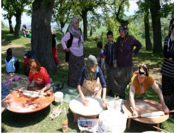
Fotoğraf 7: Hıdrellez günü hıdırlığa gelenlere ikram etmek için gözlemeler pişirilir.

yapılacağı mekânda toplanılır. Hıdrellez etkinliklerine Kur'an-ı Kerim ve İlahiler okunarak başlanır. Cemaatle kılınan öğle namazının ardından tanıtım konuşmaları yapılır ve ardından yemek yenir. Yemeklerin bir kısmı etkinlik alanında hazırlanır. Kadınlar tarafından hamur yoğrulur, sofralar kurularak yufkalar açılır, lokmalar çekilir, gözlemeler pişirilir (Fotoğraf 7 ve 8). Yemeğin ardından çeşitli yarışmalar, hediye çekilişleri ve etkinlikler gerçekleştirilir.