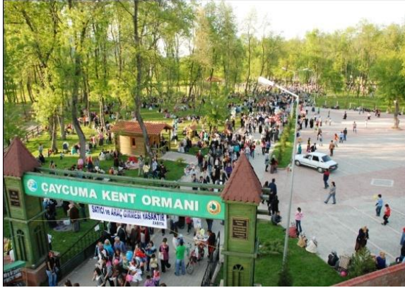
Fotoğraf 15: Her yıl 9 Mayıs tarihinde, Çaycuma İlçesi Pehlivanlar Mahallesi'ndeki Kent Ormanında Hıdrellez etkinlikleri düzenlenir.