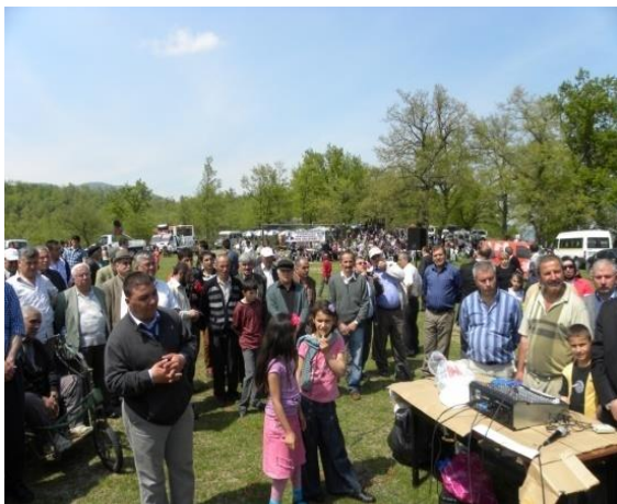
Fotoğraf 5: Çaycuma ilçesine bağlı Dağüstü köyünde düzenlenen Hidrellez etkinliklerine yöre halkı yoğun ilgi göstermektedir.

Hidrellez etkinlikleri için su, yeşillik, ağacın bol bulunduğu (varsa türbelere yakın) mekânlar tercih edilir. Hıdırlık adı verilen bu mekânlar bir yerleşmeye ait olabileceği gibi iki-üç yerleşmenin ortak kullanımına da sahne olabilir. Örneğin Dağüstü köyünde düzenlenen etkinlikler Hatıplar Mahallesi'ndeki Hatıp Baba Türbesi'nde dört mahallenin katılımıyla gerçekleştirilir (Fotoğraf 5 ve 6).