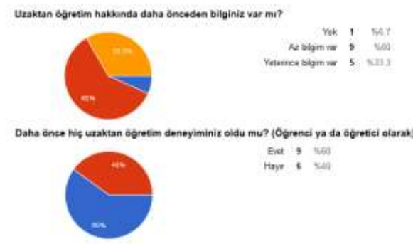
Şekil 2. Katılımcıların uzaktan eğitim bilgi ve deneyimi

Araştırmaya katılan öğretim elemanlarından 5'i uzaktan eğitim hakkında yeterince bilgisi olduğunu ifade ederken 9 kişi az bilgisi olduğunu bir kişi ise hiç bilgisi olmadığını belirtmiştir. Katılımcılardan %60'ı (f= 9) daha önce öğrenci veya öğretici olarak uzaktan eğitim deneyimi olduğunu ifade etmiştir. Bu veriler araştırmaya katılan öğretim elemanlarının büyük çoğunluğunun uzaktan eğitim hakkında bir şekilde bilgi sahibi olduğunu göstermektedir (Şekil 2).