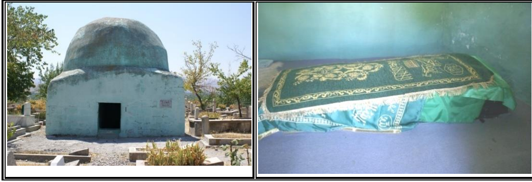
Fotoğraf 1. Ali Baba Mezarlığı'nın orta kesiminde bulunan Alibaba Türbesi'nin dış ve iç mekânından görünüşü.

Halk arasında Ali Baba diye zikredilen zatın, şehit düştüğü yere gömüldüğüne inanılır. Ali Baba Türbesi'de Karababa Türbesi (Kara Zaviyesi) gibi 1530 yılındaki Osmanlı vakıf defterlerine kayıtlı bir diğer türbedir (Gülsoy ve Taştemir, 2007: XXXVII). Kara Baba türbesi ve mezarlığı gibi Ali Baba Türbesi ve mezarlığı da özellikle Cuma günleri halkın yoğun olarak ziyaret ettiği yerlerdendir.