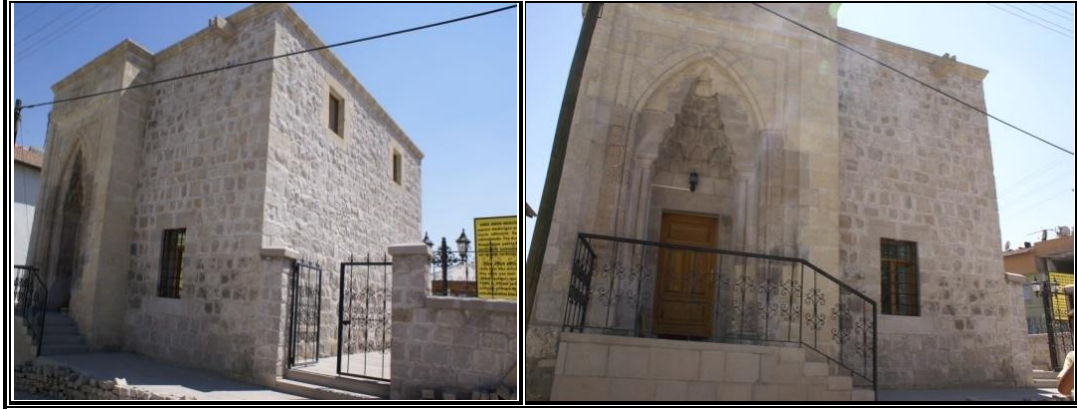
Fotoğraf 6. İlçe merkezinin hemen bir km kadar güneyinde Çatlak denilen mevkiide yer alan Emir Ömer Mescidi ve Türbesi.

“Eski Malatya kalesinin kuzey cephesinde, çatlak olarak bilinen (Eski bir mesire alanı) mevkide, sur kapısı girişinde, içerisinde Emir Ömer bey yatırını olan küçük bir mescittir (Şekil 2). Kesme taş ile yapılan bu mescit, giriş kapısı işlemeciliği ile Osmanlı mimarisinin tipik bir örneğidir” (www.battalgazi.bel.tr, 2016), (Fotoğraf 6). İçerisinde bulunan yatırın, Battalgazi dönemindeki Emir Ömer Bey olması ihtimali zayıftır. Melik Sunullah ailesinden bir mensup olarak gösterilmektedir (www.battalgazi.gov.tr, 2016).