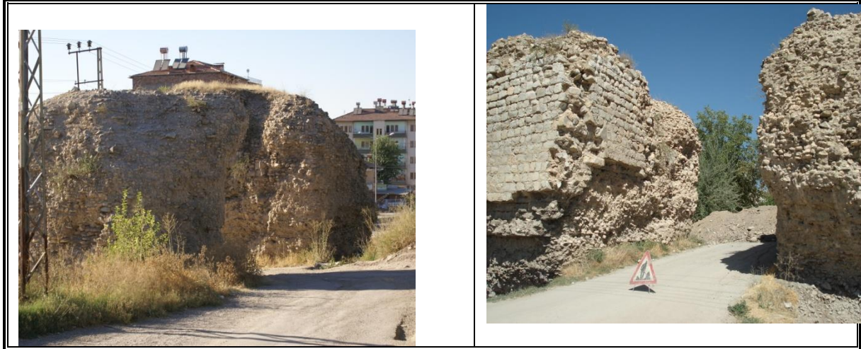
Fotoğraf 9. Şehrin giriş kapılarından biri olan Sepidros kapısından bir görünüş.

Malatya surlarının beşi doğusunda, biri kuzeyinde, biri batısında, dördü güneyinde olmak üzere 11 sur kapısı bulunmaktadır (Şekil 2), (Fotoğraf 9). İçlerinde isimleri tespit edilenler Alacakapı, Meşakkapı, Pazarkapısı, Süsürkemkapı, Sepidros, Börüdiyye, Yediboy (Sepidro) Kapısı, Bağdat Kapısı, Gizli Kapıdır. Ana giriş kapıları dışında, diğer kapılar dar girişli, burçlar üçgen yapıda, diğer surlardan biraz daha iri olarak yapılmış, ana giriş kapıları ise sekizgen bir geometridedir. (www.battalgazi.gov.tr, 2016).