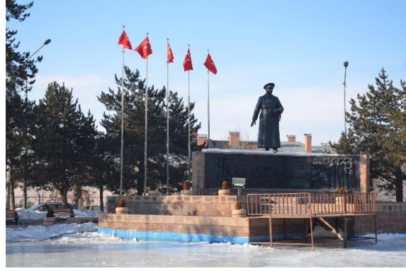
Fotoğraf 26. Atatürk Heykeli ve Erzurum Kongresi Anıtı'ndan görünüm