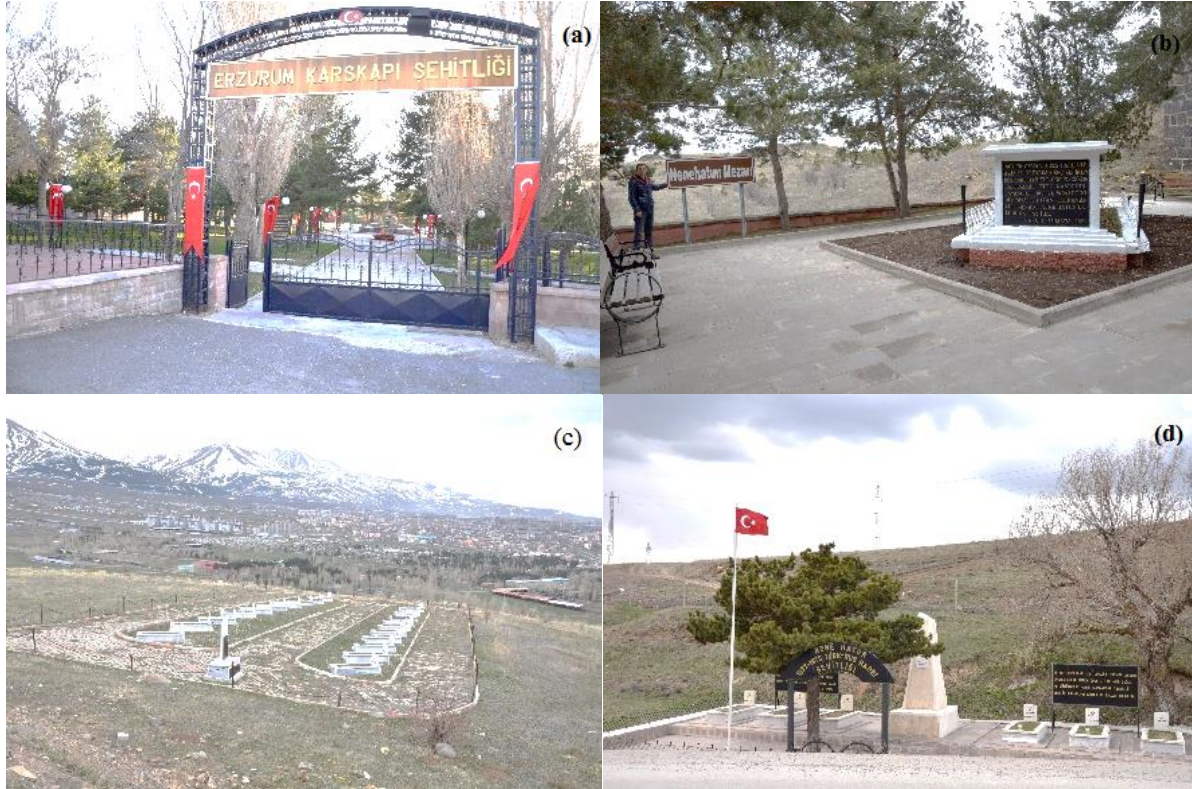
Fotoğraf 31. Karskapı şehitliği (a), Nene Hatun mezarı (b), Nene Hatun Milli Park içerisindeki şehitlik 1877-1878 Türk-Rus Harbi şehitliğinden görünüm

Erzurum şehri ve çevresinde Karskapı şehitliği (Fotoğraf 30 (a)), Pasinler Köprüköy Şehitliği, Oltu Şehitliği, Kandilli Garnizon Şehitliği, Alaca Şehitliği, Yanıkdere Şehitliği, Nene Hatun mezarı (Fotoğraf 31 (b)), Aziziye Tabyası I yanındaki şehitlik (Fotoğraf 31 (c)), Nene Hatun 1877-1878 Türk-Rus Harbi şehitliği (Fotoğraf 31 (d)) bulunmaktadır.