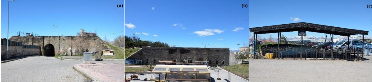
Fotoğraf 2. Kavak (Ardahan) Kapı (a), İstanbul Kapı (b) ve Harput Kapı (c)'sından görünüm

(Küçükkuşurlu, 2015: 52-53). Daha sonraki süreçlerde surlar yıkılmış ve bu kapılar genellikle tahrip olmuştur. Yakın tarihlerde restore edilen İstanbul kapısı ve çevresi günümüzde rekreasyon alanı olarak kullanılmaktadır.