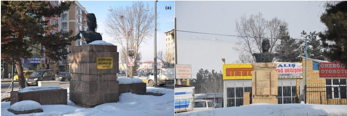
Fotoğraf 27. Hastaneler Caddesi (a) ve Mahallebaşı'nda (b) bulunan Kazım Karabekir Anıtı'ndan görünüm

Mahallebaşı'nda yer alan anıt, basit bir düzenlemeye sahip olup, bir kaide üzerinde Kazım Karabekir Paşanın büstüne yer verilmiştir (Yurttaş vd., 2008: 312). Kazım Karabekir Paşa'nın kurtuluş savaşı boyunca göstermiş olduğu kahramanlıklar ve Erzurum'da bulunması sebebiyle önemli bir şahsın anıtla yaşatılması oldukça önemlidir (Fotoğraf 27 (b)).