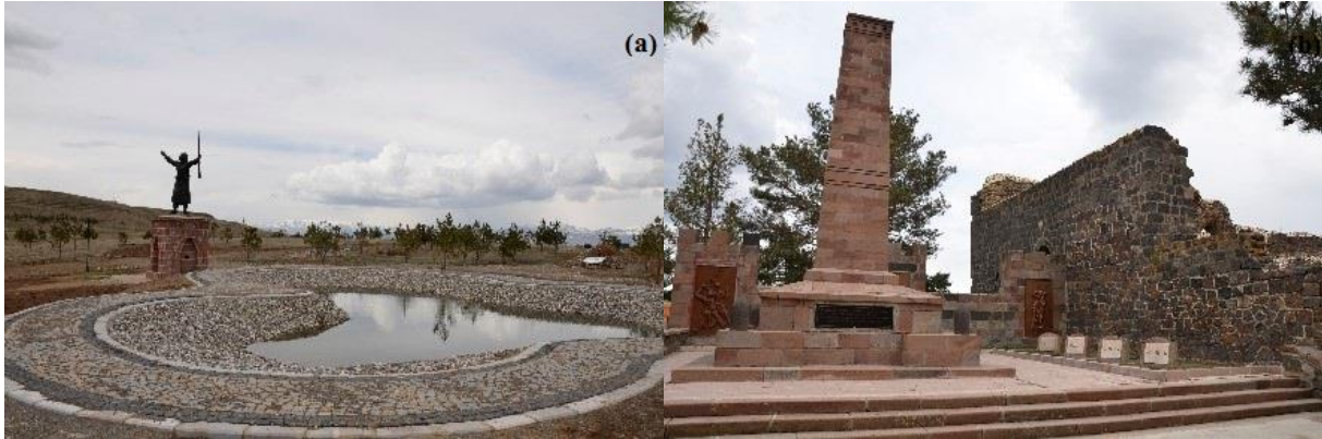
Fotoğraf 28. Milli Park İçerisindeki Nene Hatun Anıtı (a) ve Aziziye Tabyası I (b) içerisindeki anıttan görünüm