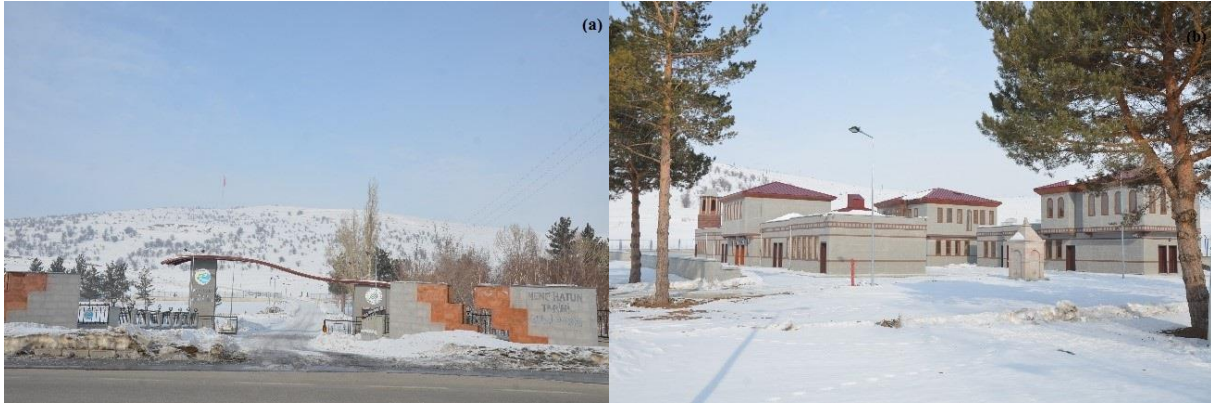
Fotoğraf 3. Nene Hatun Tarihi Milli Parkı girişinden (a) ve yeni yapılardan (b) görünümü