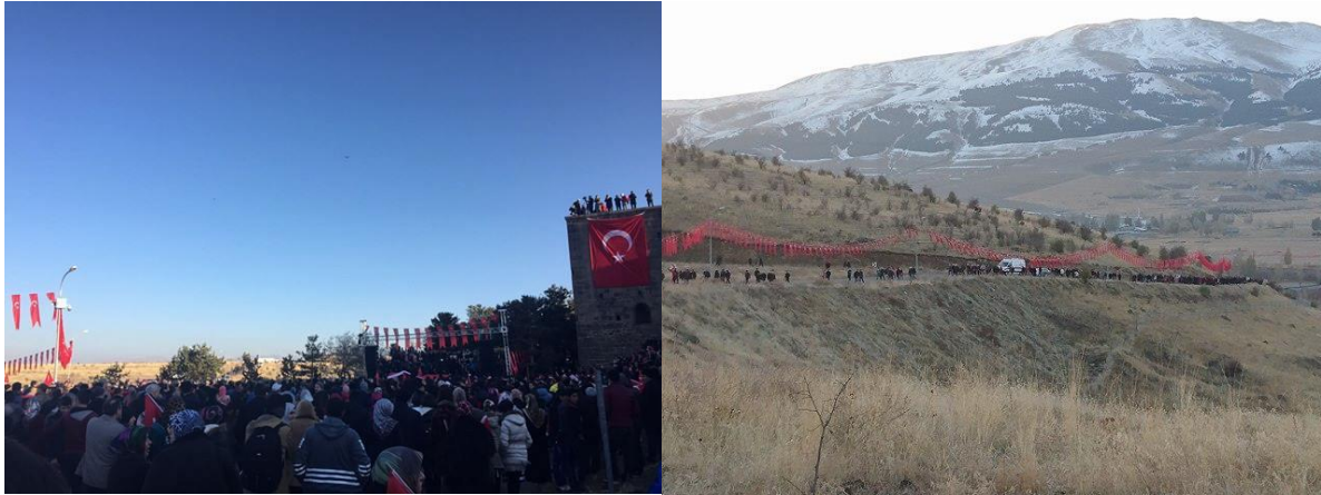
Fotoğraf 34. 12 Kasım 2016 tarihinde yapılan 93 Harbi şehitlerimizi anma töreninden görünüm

Birçok önemli olaya sahne olmuş savaş alanları, çeşitli nedenler ve motivasyonlar ile milyonlarca insan tarafından ziyaret edilmektedir. Savaş alanları hükümetlerin, sivil toplum kuruluşları, çeşitli vakıf ve derneklerin çabaları ile birçok turizm etkinliğine sahne olmaktadır. Bunların başında ise anma törenleri gelmektedir. Sosyal projeler, anma törenleri ile beraber gerçekleştirilecek özel organizasyonlarla binlerce insan için turizm etkinlikleri düzenlenebilmektedir (Atay ve Yeşiltaş, 2010: 70-71). Bu kapsamda 2016 yılında dernek, vakıf ve belediyenin katkılarıyla 6.'sı düzenlenen Geleneksel Nene Hatun ve Şehitleri Anma Günleri 12 Kasım tarihinde çeşitli etkinliklerle gerçekleştirilmiştir (Fotoğraf 34).