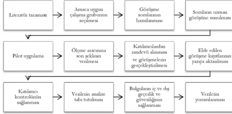
Şekil 1. Araştırma Sürecine İlişkin Akış Şeması

öğretmenlik uygulamasına katılan her bir grup (uygulama öğretmeni, öğretmen adayı) analiz birimi olarak kabul edilmiştir. Araştırmanın tasarlanması ve uygulanmasına ilişkin akış şeması Şekil 1'de gösterilmiştir.