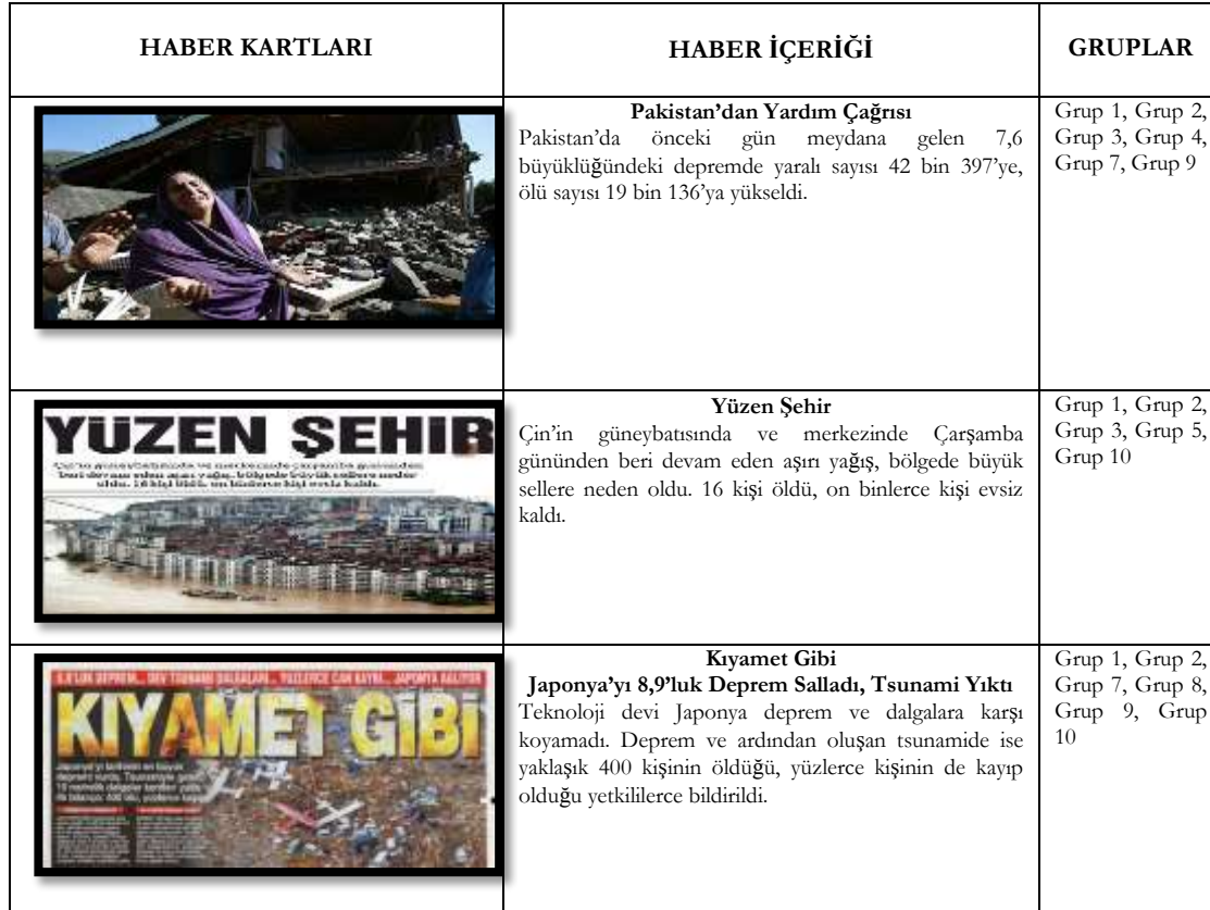
Tablo 1. Uluslararası yardıma gerek duyulan haber kartları ve gruplara göre dağılımı

Etkinlik kapsamında öğrencilerin küresel sorunlara karşı gösterdikleri duyarlılıkları belirlemek amacıyla araştırmacılar tarafından önceden hazırlanan, dünyadan haberlerin yer aldığı haber kartları gruplara dağıtılmıştır. Bu haber kartlarında, Pakistan depremini içeren ‘Pakistan’dan Yardım Çağrısı’ haberi, Çin’de yaşanan sel felaketini konu alan ‘Yüzen Şehir’ haberi, Japonya’daki tsunami ve deprem haberini içeren ‘Kıyamet Gibi’ manşetli haber, Kanada’da da yaşanan sel felaketini içeren ‘Kanada’yı Sel Aldı’ haberi, gemi kazasının yer aldığı ‘Türklerin de İçinde Olduğu 2 Ayrı Gemiden 2 Felaket’ haberi, Somali’deki kuraklığın neden olduğu ölümleri konu alan ‘Somali’de Yürek Burkan Rapor’ ve son olarak da Hindistan’da yaşanan bir tren kazasını içeren ‘Hindistan’da Tren Kazası’ manşetli haberler bulunmaktadır. Öncelikle grupların hepsine aynı haber kartları verilerek, onlardan dağıtılan haber kartları arasındaki haberlerden hangilerinin doğal afet haberi olduğu ve hangilerine uluslararası yardım yapılması gerektiğini belirlemeleri istenmiştir. Grupların uluslararası yardım yapılmasına gerek duydukları haber kartları ve gruplara göre dağılımları Tablo 1’de verilmiştir.