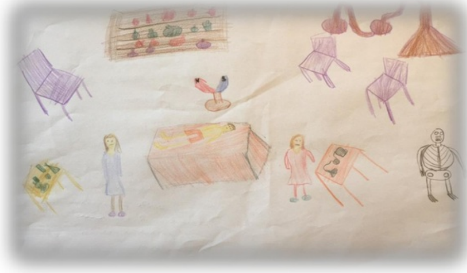
Resim 3. Melike'nin resmi ve açıklaması

Akgün, Çinici, Yıldırım ve Köprübaşı (2015), yaptıkları çalışmaya paralel olarak, yapılan çalışmada öğrencilerin verdikleri örneklerin genellikle ders kitabında bulunan örnekler olduğu gözlenmiştir. Ders kitabında yer almayan ancak öğrencilerin yakın çevresinden daha çok örnekler olmasına rağmen bunların fark edilemediği gözlemlenmiştir. Bu durum öğretmenlerin ders işlerken kitaplara bağlı kalmasından kaynaklanmış bu sebeple öğrenciler ezbere sürüklenmiş olmasından kaynaklanmış olabilir.