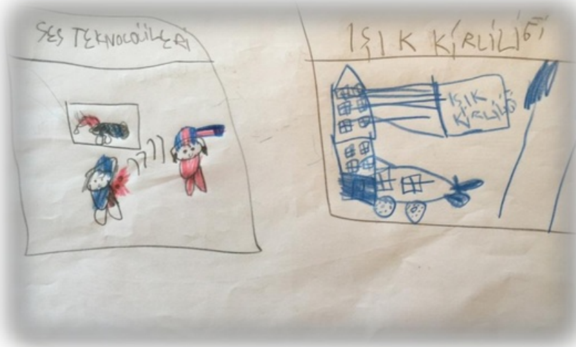
Resim 5. Ali' nin resmi ve açıklaması

öğrenci ise doğa temalı güneş, bulutlar ve hava olaylarını resmetmiştir. Laboratuvar temalı resim çizen erkek öğrencilerinin çoğunluğu resimlerinde, katı-sıvı-gaz yazılı deney tüpleri, mıknatıs, iskelet sistemi modeli çizdikleri gözlenmiştir. Öğrencilerin ders müfredat programlarında yer alan “duyu organlarımız”, “teknolojik gelişmeler”, “vücudumuz ve sistemler”, “maddenin sınıflandırılması” ve “çevre kirliliği” konularından etkilendikleri görülmektedir.