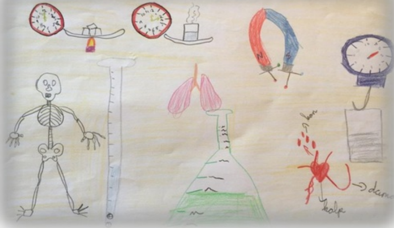
Resim 2. Asya'nın resmi ve açıklaması

Taşkın ve arkadaşlarının yaptıkları çalışmada (2002), idarecilerin % 87,09'u yapılan fen laboratuvarı deney uygulamalarını yetersiz bulduklarını, laboratuvar uygulamalarını öğretim yılı boyunca ortalama hangi sıklıkla yapıyorsunuz? sorusuna, öğretmenlerin %10'u her ders sonu, %16'sı haftada bir, %18'i ayda bir ve %13'ü ise dönemde bir defa diye cevaplamışlardır. Soruya yapmıyorum diye cevap verenlerin oranı %43 olarak saptanmıştır. Öğretmenler laboratuvar çalışması yapmama kararlarının gerekçesi olarak, kalabalık sınıfları, kırılan veya bozulan malzemelerin temini, derslik yetersizliği, malzeme eksikliği, zaman ve basılı kaynak yetersizliği gibi etkenleri göstermişlerdir (Taşkın, Ekici ve Taşkın, 2002)