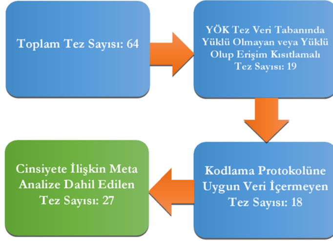
Şekil 1. Alanyazın taraması sonucu ulaşılan kaynakların araştırmaya dâhil edilme sürecine ilişkin akış diyagramı