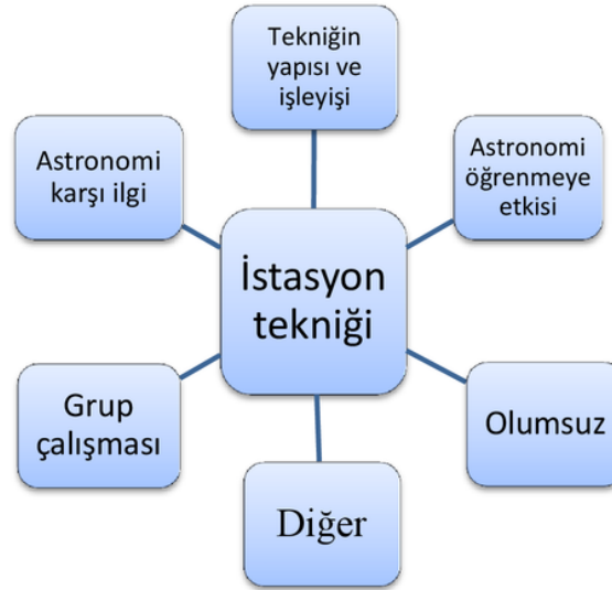
Şekil 2 Öğrenci görüşleri sonucunda oluşturulan kategoriler

Astronomi kavramlarının öğretilmesi için hazırlanan öğrenme istasyonlarına dair öğrenci görüşlerinin içerik analizi sonucunda; (1) istasyon tekniğinin yapısı ve işleyişi, (2) astronomi öğrenmeye etkisi, (3) astronomiye karşı ilgi, (4) grup çalışması, (5) olumsuz ve (6) diğer olmak üzere 6 kategori altında toplanmıştır. Bu kategoriler Şekil 2’de verilmiştir.