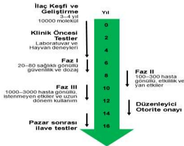
Şekil 2. Prelinik Araştırma Döneminin Fazları