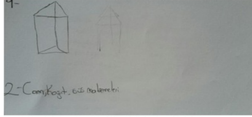
Şekil 1: Öğrencinin birinci etkinlikteki farkındalık katmanına yönelik cevabı

Tablo 10'da görüldüğü gibi Deneyim grubundaki öğrenci haricindeki tüm öğrenciler farkındalık düzeyinden her etkinlikte tam puan almışlardır. Deneyim grubundaki öğrenci de başlangıçta daha düşük olan puanını son etkinliklerde arttırmıştır.