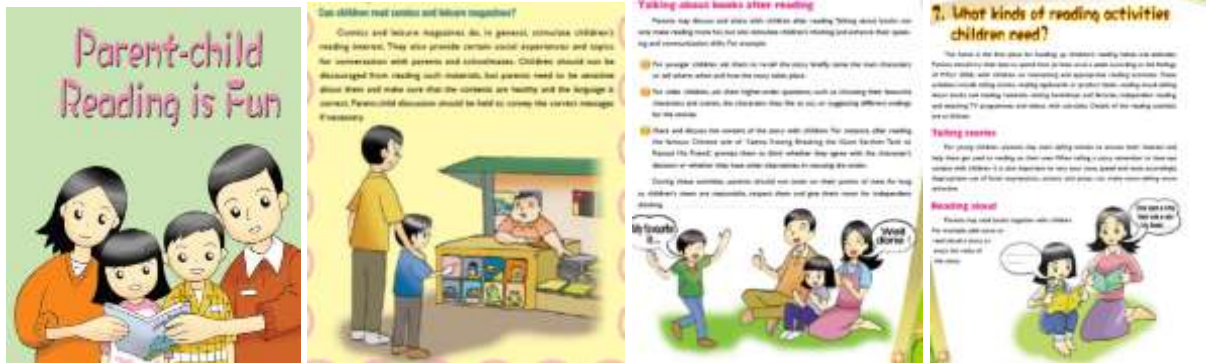
Şekil 2. Aile-çocuk okuma kılavuzu (Curriculum Development Institute, 2010).