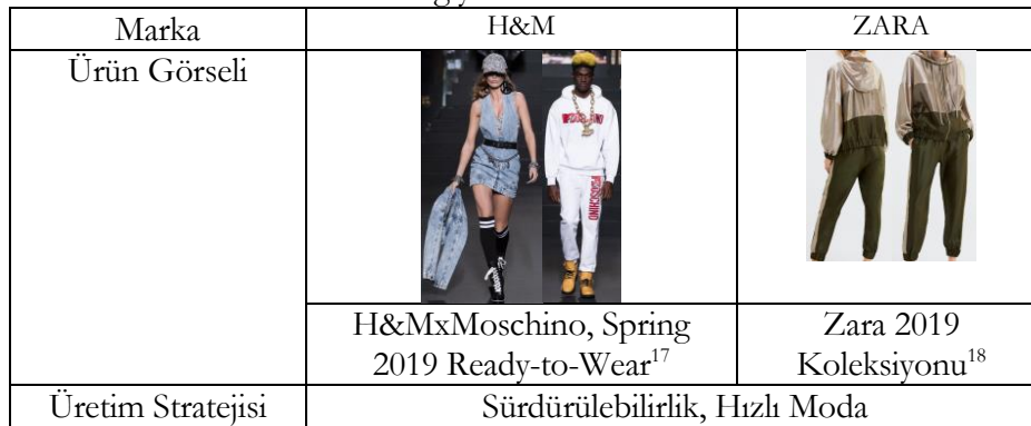
Tablo 3: Orta ekonomi düzeyi gelir grubuna lüks giysi üretimi yapan ünlü markalarının athleisure giysi örnekleri

Elk (2004)'ün dört ölçütüne dayanarak incelenen orta ekonomik gelir grubuna üretim yapan markaların ürünlerindeki özellikler Tablo 3'de verilmiştir. Sağlığa yararlı tasarımlarda, akıllı dikişleri ve 3D tasarım teknolojilerini kullanan hızlı modanın öncülerinden H&M markası, üçüncü Küresel Değişim Ödülünün (Global Change Award) sahibi olmuştur (H&M, 2018). Hızlı moda stratejisinin diğer örnek markası Zara, 2019 yılı koleksiyonuyla sürdürülebilir teknoloji destekli malzeme ve üretim ile erişilebilir spor lüks ürün düşüncesini desteklemektedir.