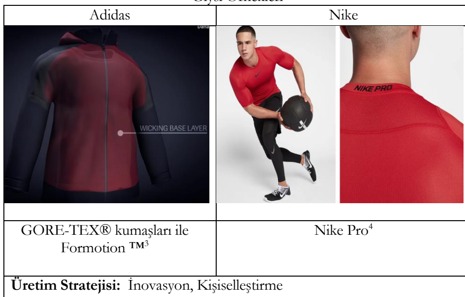
Tablo 1: Her Düzeydeki Gelir Gruplarına Spor Giysi Üretimi Yapan Ünlü İki Markanın Athleisure Giysi Örnekleri

Reebok markasının BareMOVE teknolojisi ile ürettiği “One Series” Koleksiyonu da nefes alabilirlik, hareket özgürlüğü ve koruma (Adidas, 2018) özellikleri ile spor giyimden athleisure giyime teknoloji tasarımı transferinin iyi örneklerini sunmaktadır.