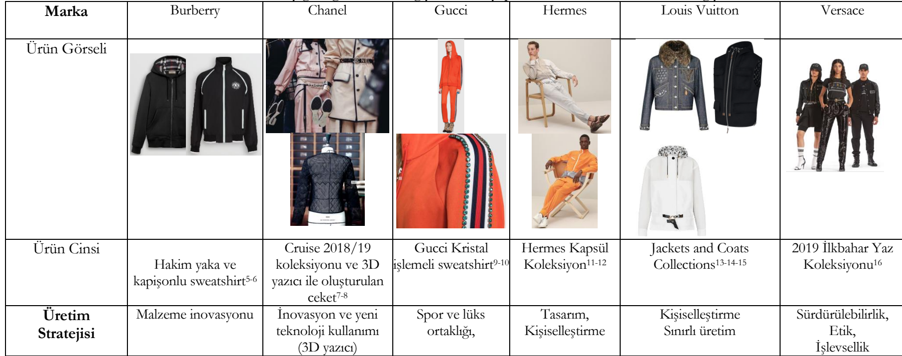
Tablo 2: Üst ekonomik düzey gelir grubuna lüks giysi üretimi yapan ünlü markalarının athleisure giysi örnekleri