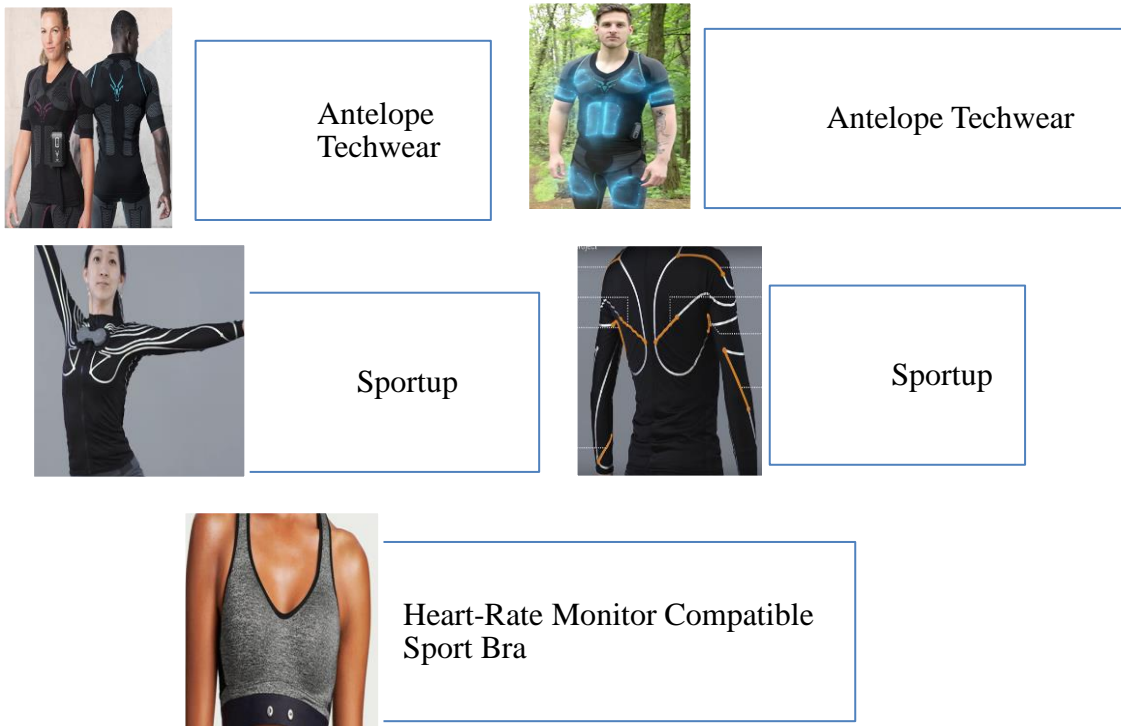
Şekil 2: Giyilebilir Teknoloji Tasarımının İlk Örnekleri (Antelope.Club, 2018; Sportup, 2017; Saral, 2014).

Geçmişteki kalın buz pateni kıyafetleri soğuktan korumayı amaçlayan ceket ve uzun etekten oluşmuş iken bugünküler oldukça ince, vücut formunu alan esneklik ve konfora sahip kişiye özel tasarım detaylarını taşımaktadır. Bugünkü kıyafetlerde modern tasarım çizgisi ve teknoloji desteği ile akıllı giysi ve nano teknolojinin kullanımı ürünlerin kullanım alanını da genişletmiştir. Yakın dönemde, Adidas için Yohji Yamamoto'nun hazırladığı Y-3 koleksiyonu; Stella McCartney'in jimnastik, yüzme ve tenis dallarına özel performans giysileri; Paul Smith'in Rapha ve Nike markası için tasarladığı "Gyakusou" koşu koleksiyonu; (Sorger and Udale, 2013, s. 163) spor marka ve tasarımcı işbirliğine örneklerdir. Bu örnekler teknoloji destekli malzeme ile hazırlanan spor giysi tasarım düşüncesinin nasıl ilerlediğini ortaya koymaktadır.