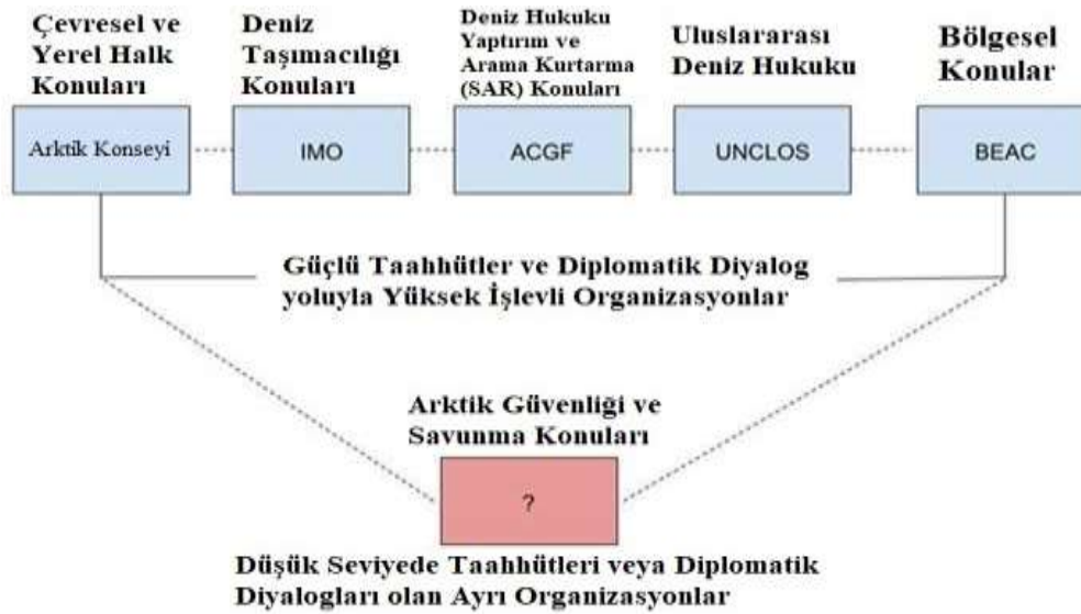
Şekil-1. Arktik Bölgesi'ndeki Uluslararası Kurumların Görev, Yetki ve Sorumluluk Alanları

RF ve ABD'nin Arktik politika, doktrin, strateji ve uyuşmazlık konularını ele alan güncel literatür incelendiğinde iki temel yaklaşımın olduğu görülmektedir. Bunlardan ilki, kaynakların paylaşımına yönelik uyuşmazlıkları ve olası askeri müdahaleleri konu eden realist bakış açısıyla yapılmış çalışmalardır. İkincisi ise mevcut iş birliği ve yönetişimi öne çıkararak vurgulayan ve sayıca daha az olan liberal bakış açısıyla yapılmış çalışmalardır. Uyuşmazlık boyutlarını realist bir bakış açısıyla irdeleyerek, iş birliği ve yönetişimle sentezleyebilen çalışma sayısı ise oldukça azdır (Ohnishi, 2014).