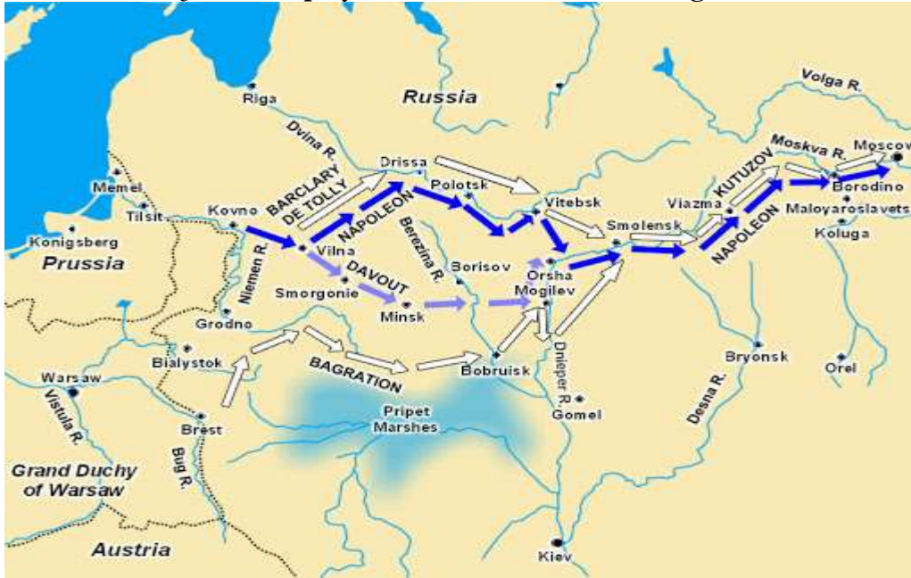
Şekil 1: Napolyon'un Moskova Seferi Güzergahı

Fransız Ordusundaki lojistik yetersizlik askerlerin firar etmelerine, atların telef olmasına yol açtığı gibi başarısızlığın da önemli sebeplerinden biri oldu. Napolyon, lojistik sorunların farkında idi ve doğu istikametinde ilerlemeye devam etti ve muharebe gücünün önemli ölçüde lojistik sisteme bağlı olduğunu ihmal ederek, Rusları bir an önce yakalama telaşına girdi. Vilna'dan doğuya ikmal akışı yapılamadığı için Fransız Ordusunun "savaşabilir" seviyede tutulması pek de mümkün olamadı. Yağma yönteminin başarılı olmaması, yerel kaynakların yokluğundan kaynaklanıyordu. Fransız Ordusu, Vitebsk'i terk ederken yaklaşık üçte biri savaşamaz durumdaydı. Buna rağmen Napolyon, Simolensk istikametinde ilerlemeye devam etti. Askerlerin yiyecek sorunlarına ilave olarak Rusların Kossak (Kazak) birliklerinin baskın saldırıları da Fransız ordusunun muharebe gücünü yıprattı (Reihn,1990: 22).