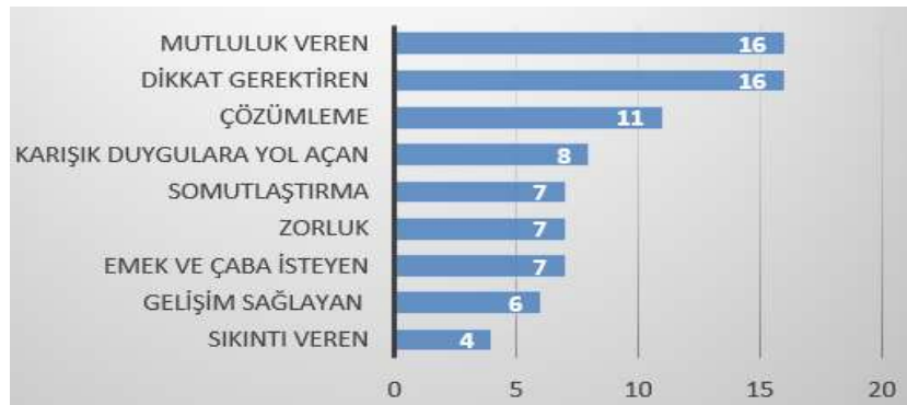
Şekil 1. Müzik öğretmeni adaylarının geliştirdikleri metaforlara ilişkin kategoriler