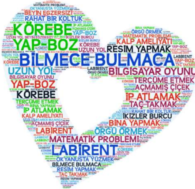
Şekil 2. Müzik öğretmeni adaylarının dikte yazmaya ilişkin oluşturdukları metaforlara ilişkin kelime bulutu

Çalışmada ayrıca müzik öğretmeni adaylarının dikte yazmaya ilişkin oluşturdukları metaforlara ilişkin kelime bulutu oluşturulmuştur. Oluşturulan kelime bulutu Şekil 2’de verilmiştir.