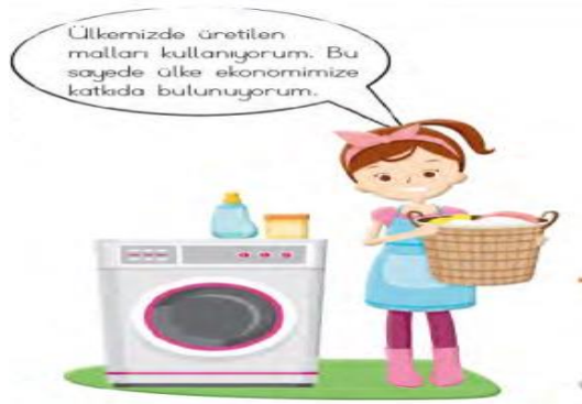
Görsel 7. Bir ev hanımı (s.76)