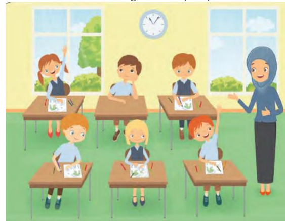
Görsel 6. Sınıfta bir öğretmen (s.62)