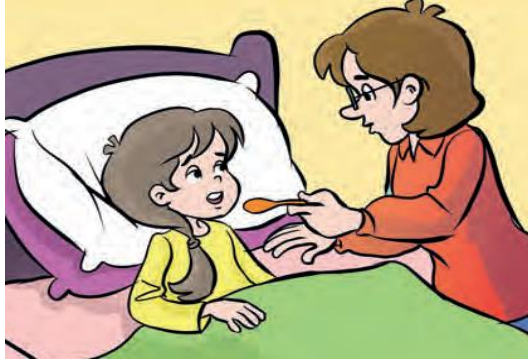
Görsel 1. Çocuğuyla ilgilenen bir anne (s.58)