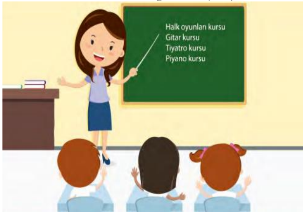
Görsel 5. Ders anlatan bir öğretmen (s.24)