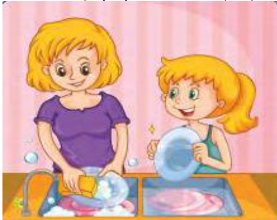
Görsel 3. Bulaşık yıkayan kadın ve kızı (s. 78)