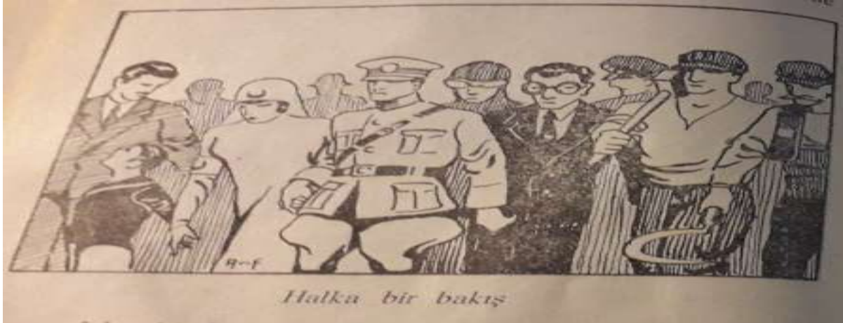
Görsel 3. Halk İradesinde Halkın Hakları ve Vazifesi

Görsel 3’de “Halk İradesinde Halkın Hakları ve Vazifesi” adlı görselde halka bakış olarak verilen öğede bütün meslek sahiplerinin erkek olarak betimlendiği halde sadece kadın sağlık çalışanı olarak betimlenmiştir (Sevinç, 1931: 40). Mesleki yaşamda kadın temasına ait kodlamalarda kadın en çok “hemşire/sağlık çalışanı” olarak verilmiştir. %7,14’lük oranla verilen “hemşire/sağlık çalışanı” kadın imgesinin dışında %4,76’lık oranla “öğretmen” kadın imgesi verilmiştir.