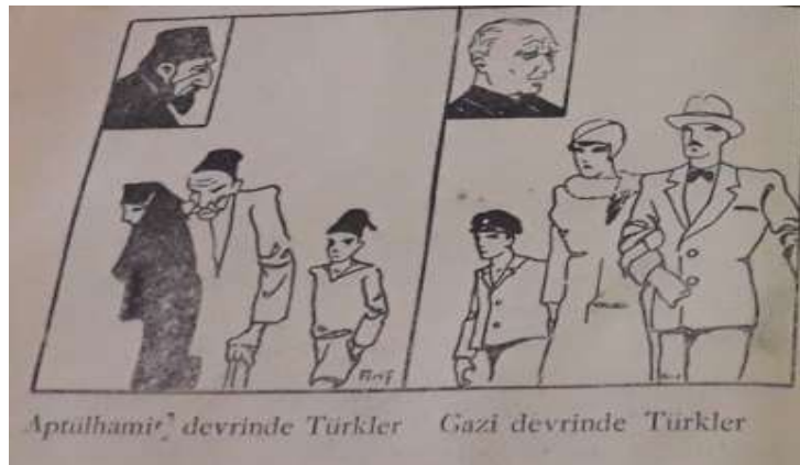
Görsel 2. Abdülhamid Devrinde Türkler, Gazi Devrinde Türkler

Görsel 2'ye göre, "Abdülhamid Devrinde Türkler ve Gazi Devrinde Türkler" olarak verilen iki resimde Abdülhamid döneminde betimlenen Türk kadını kara çarşafli ve yaşlı bir adamla evli olarak gösterilmişken Gazi dönemi Türk kadını ise modern kıyafetler giyerek, kendi yaşıtı kocasının kolunda betimlenmiştir (Sevinç, 1931: 20).