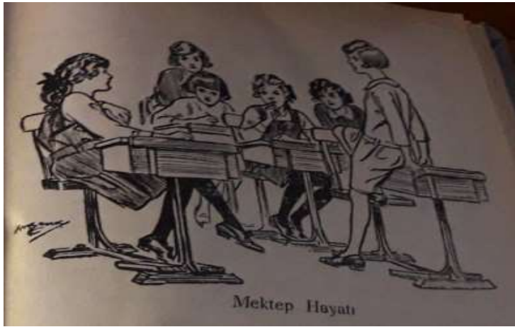
Görsel 1. Başı Açık, Türbansız, Modern Giyimli Kadın

Görsel 1'e göre %16,67'lik oranla kodlamalarda önemli bir paya sahip olan "başı açık/türbansız" kadın imgesine karşılık "Cumhuriyet döneminde türbanlı" kadın imgesi ise %9,52'lik bir orana sahiptir. Öte yandan başı açık görülen ve türbansız olarak verilen kadın görsellerinin %7,14'ü "modern giyimli", %11,91'i ise "kısa saçlı/saçı bağlı" kadın imgesi ile verilmiştir (Sevinç, 1931: 33).