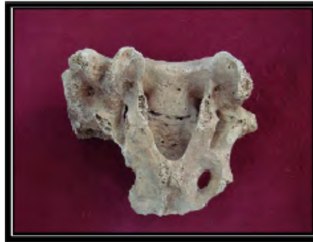
Tablo 13: Kyzikos'ta lahit mezardan çıkan omurlarda gözlenen osteofit ve schmorl nodülü