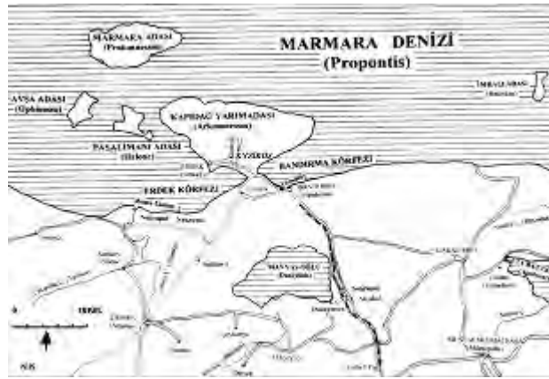
Harita 1: Koçhan, N., Kyzikos Tarihi ve Mimari Kalıntıları, Çizim 1 (Baskıda)

Kyzikos antik kenti kazı çalışmaları, kentin kuzeybatısında yer alan Batı nekropol alanı (M.S. 2. yy) ve M.S. 2. yüzyılda yapılmış bir tapınma yeri olan ve daha sonra depremle yıkılan Ortaçağ döneminde doğu ve güney yönü mezarlık alanı olarak kullanılan Hadrian Tapınağı olmak üzere iki farklı alanda sürdürülmektedir. Kentin Batı nekropolünde bulunan bir lahit ve bir oda mezar MS. 2. yüzyıla, Hadrian Tapınağı'ndan çıkarılan dört kiremit mezar ve iki küp mezar da Ortaçağ'a tarihlenebileceği hafirler tarafından belirtilmiştir (Koçhan ve diğ., 2009: Nurettin Koçhan sözlü görüşme). Lahit mezarda; 7 adet cam unguentarium, 4 adet pişmiş toprak unguentarium, 4 adet cam kâse, 1 adet pişmiş toprak kap, 1 adet iki parçaya bölünmüş iğne, 4 adet impression altın pul, bir çift altın küpe, 1 adet yüzük taşı ve çok sayıda kırılmış cam ve seramik parçaları, oda mezarda; 1 adet altın kolye, 2 adet impression altın pul, 3 adet altın küpe, 1 adet altın kolye parçası, 1 adet altın yüzük, 2 adeti yuvarlak 6 adet ince uzun siyah boncuk, 11 adet pişmiş toprak unguentarium ve 1 adet terra cotta figür gibi ölü hediyelerine rastlanmıştır. Asıl mezar sahiplerine ait olduğu düşünülen seramik